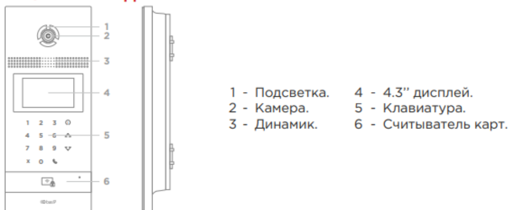
Рис. 5. Внешний вид и органы управления блока «BAS-IP UKEY».