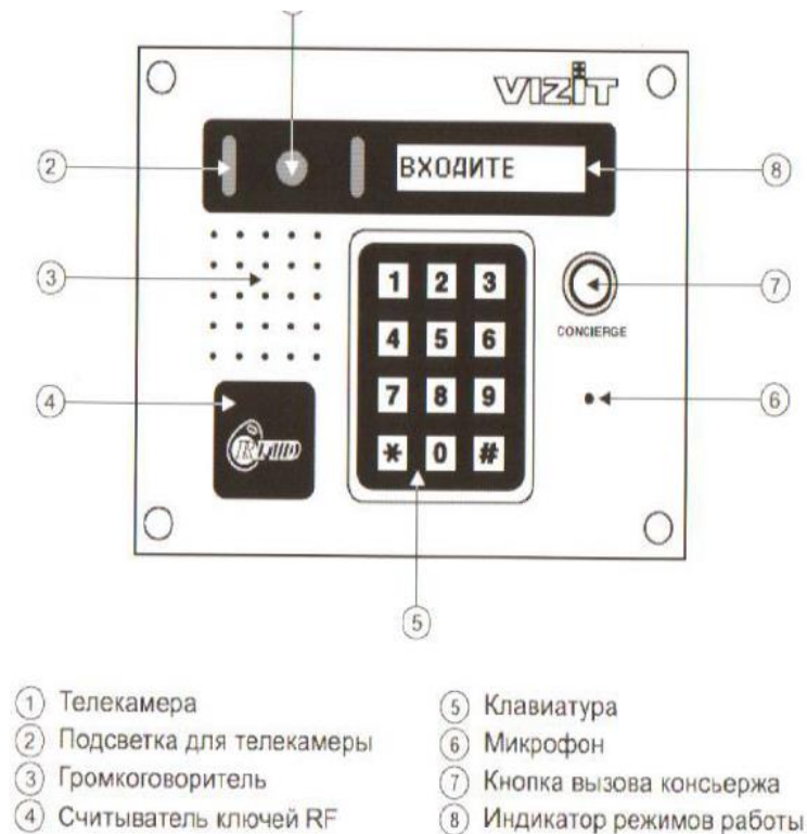
Рис. 5 Внешний вид и органы управления блока.